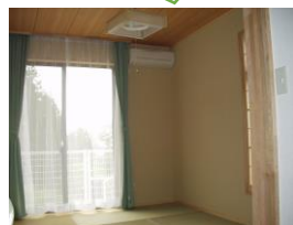
押入・洗面・エアコン付