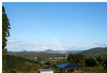
みずなしの丘から望む風景